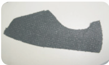
Coating in spots on inner parts 鞋面內貼上膠