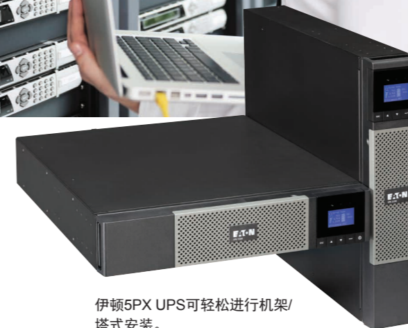
伊顿5PX UPS可轻松进行机架/塔式安装。