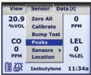
直观菜单使用户能够轻松的操作

2011年, MX6应急救援和救生舱专用四气体版本MX6-ma (CO 2 , CO, O 2 , CH 4 )获得了中国煤矿安全认证。