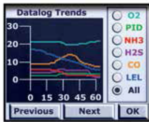
能够以图形的方式查看动态数据日志及直接读数