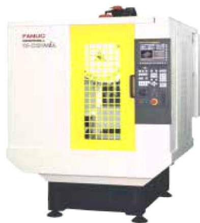
约20-33万台，中国占全球产能70%，对应CNC需求约14-23万台。一台CNC单价约23万，因此对应国内市场空间约320-530亿。