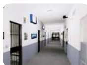
军事监狱 办公室、仓库、 保密室，监狱二道门