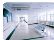
医疗领域 药房、手术室门禁