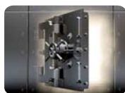
金融机构 ATM门、员工通道