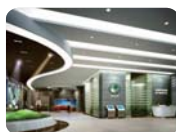
政府司法 行政办公室门禁