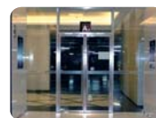
民用企事 办公室、建筑工地 门禁管理