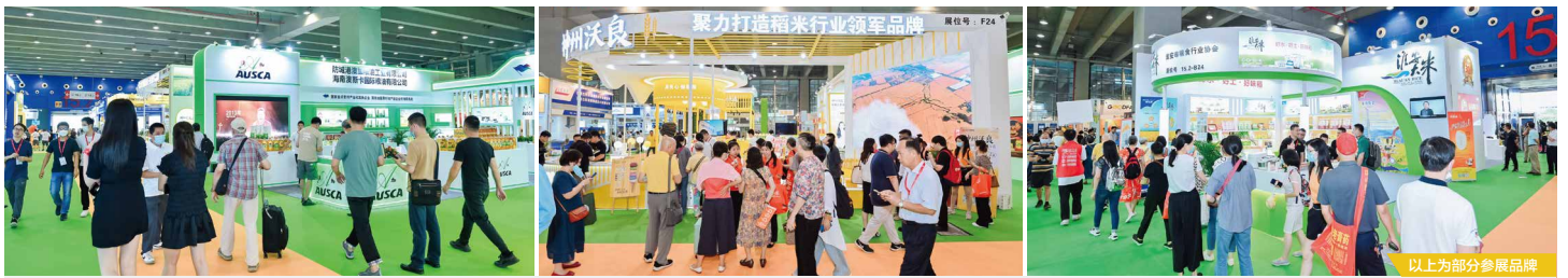
以上为部分参展品牌

根据机构的调研, 2022年我国大米行业市场规模达到7234亿元, 近五年年均符合增长率为1.09%, 预计2023年全国大米市场规模将达到7413亿元。随着国民经济以及消费需求持续向好, 中高端大米逐渐受到年轻、购买力强的消费人群的喜爱, 消费需求呈现持续增长态势, 市场规模和潜力持续快速扩张, 为品牌大米的发展提供了有利条件, 大米市场的角逐进入品牌竞争时代。