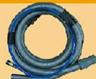
气动砂光机吸尘管