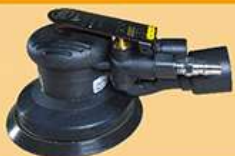
5寸静音小偏心磨机