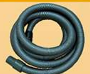
电动砂光机吸尘管