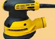
5寸电动小偏心砂光机