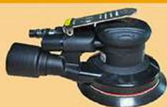
5寸静音中偏心砂光机