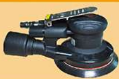
5寸静音中偏心磨机