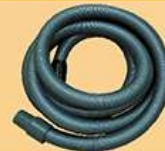
电动砂光机吸尘管