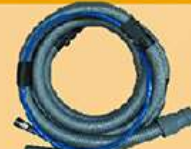
气动砂光机吸尘管