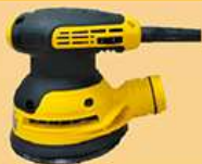
5寸电动小偏心砂光机