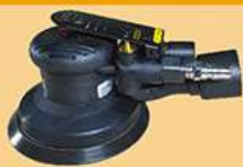
5寸静音小偏心砂光机