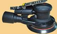
5寸静音中偏心砂光机