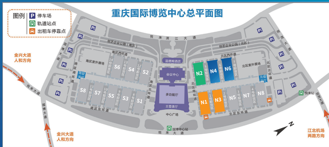
重庆国际博览中心总平面图