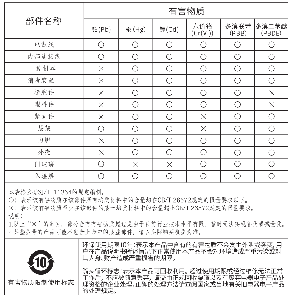
有害物质的名称和含量表

以上标识均依据中国有害物质限制使用管理办法及其配套标准SJ/T 11364要求执行。 本产品长期使用不会对人体产生危害, 请放心使用。