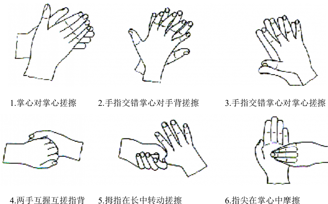
图2-1 标准的洗手方法

(9)参考样品组:对于卫生手消毒,取60%异丙醇3ml到入手心中,按标准的洗手方法用力搓擦30s。以确保手的所有部位均匀接触异丙醇。重复使用异丙醇按上述方法搓擦使总的搓擦时间为60s。对于外科手消毒,使用60%正丙醇3ml,按标准的洗手方法用力搓擦,当接近干燥时,再加3ml正丙醇搓擦。以保持作用3min。用流动的自来水冲洗5s,抖掉手上残留的水。其余步骤与试验样品组相同。