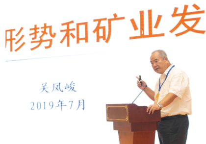
原国土资源部地环司司长关凤峻发表讲话