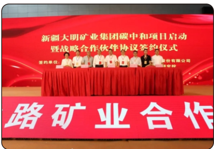
新疆大明矿业集团碳中和项目启动暨战略合作伙伴协议签约仪式