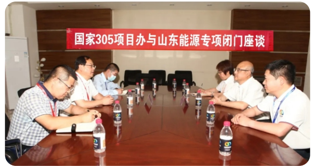
山东能源集团有限公司与新疆维吾尔自治区人民政府国家305项目办公室专项合作闭门会议