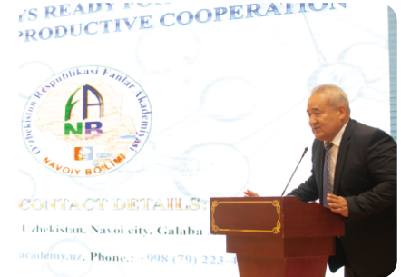
乌兹别克斯坦科学院副院长、纳沃伊分院院长、国家矿冶联合体副总裁米尔扎耶夫阿布都拉克发表讲话