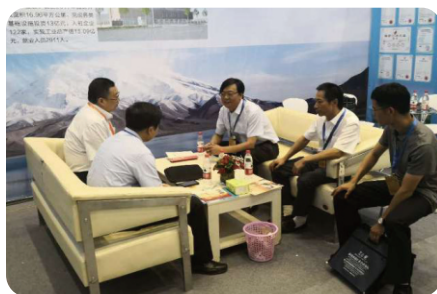
克州人民政府与中国铜业副总裁展位现场洽谈