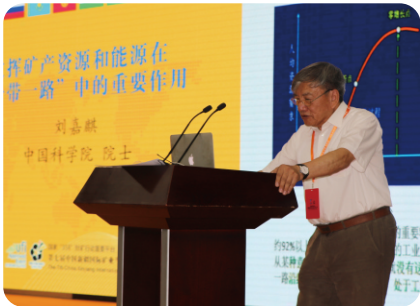
中国科学院院士刘嘉麒发表专题讲话

本届论坛聚焦“智慧矿山”、“碳达峰、碳中和”等热点话题，设有智慧矿山专题、煤化工专题、矿业权专题等三大板块，全面展现矿业最新发展态势。论坛还将联合丝路沿线省区、中亚国家和地区使领馆等，邀请有关院士及国家发改委、自然资源部、各省市(自治区)、国家305项目办公室、新疆矿联及周边国家和地区使领馆、商协会等参会并在现场开展交流探讨活动。