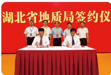
湖北省地质局与新疆远山签约仪式