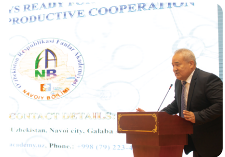
乌兹别克斯坦科学院副院长、纳沃伊分院院长、矿冶联合体副总裁米尔扎耶夫·阿布都拉扎克 发表讲话