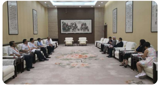
克州人民政府与吉尔吉斯斯坦国家工业、能源及矿产资源委员会专项座谈