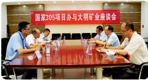
国家305项目办公室与大明矿业专项座谈