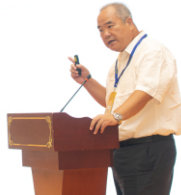
原国土资源部地环司司长关凤峻发表讲话