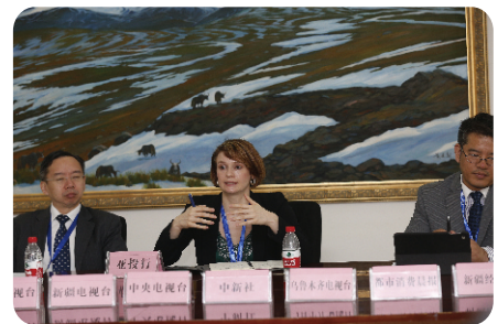
亚洲基础设施投资银行 对外联络与发展局负责人在展会现场召开媒体见面会