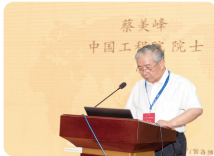
中国工程院院士蔡美峰发表专题讲话